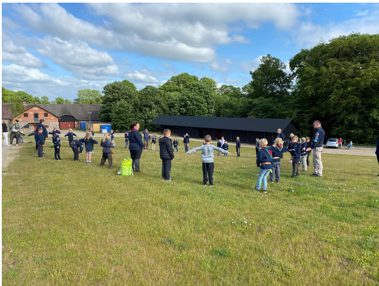
Spejder med afstand