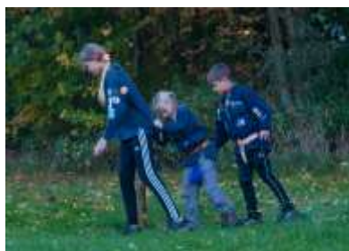
Sammen kommer vi fremad