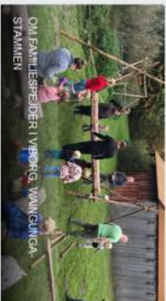
OM FAMILIESPEJDER I VIBORG, WAINGUNGA- STAMMEN