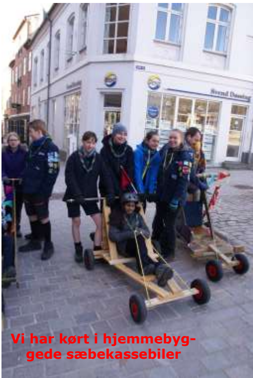
Vi har kørt i hjemmebyggede sæbekassebiler

Vi har haft et fantastisk år i troppen! Vi har haft nogle super gode weekendture og en fantastisk sommerlejr.