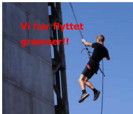
Vi har flyttet grænser!!

Og så ser vi selvfølgelig frem mod en super sommerlejr sammen med resten af gruppen.