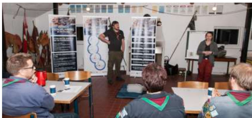
Lederne på hjertestarter kursus.