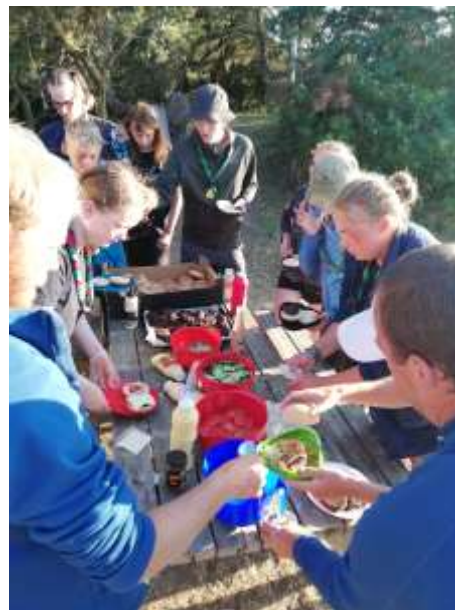
Vi har spist burgers..... mange burgers. Der går 100 boller, 8 kg kød, 10 agurker, 2 salathoveder, 30 tomater og uanede mængder ketchup, sennep, remoulade og burgerdressing til 35 troppsspejdere og 4 ledere 😊

Vi har haft et fantastisk år i troppen! Vi har haft nogle super gode weekendture og en fantastisk sommerlejr.