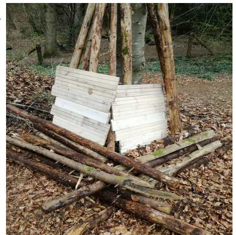
En hjemmespejderopgave for mini og mikro: Byg en hule derhjemme eller i skoven.